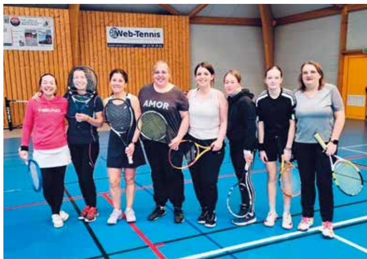
Lors de l'interclubs gagné à Villereau