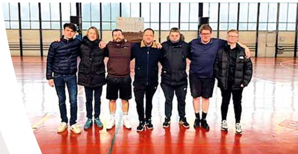
Lors de l'interclubs messieurs face au TC Sartheaux