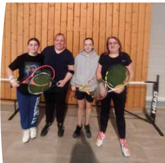
Lors du tournoi de Villereau 2 équipes de l'ASTBR se sont affrontées lors du 2e tour

femmes ont lieu le lundi de 19h30 à 21h30 et le samedi de 9h à 11h à la salle Marie-Amélie Le Fur à Recquignies. Ceux des messieurs ont lieu à la salle Oscar Doom à Boussois tous les mercredis et vendredi de 18h à 20h. Les entraînements jeunes ont également lieu à Boussois de 10h à 11h le samedi et de 11h à 12h entraînement pour les messieurs.